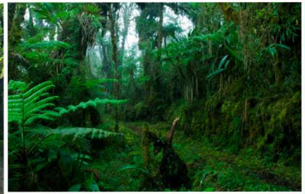
PARQUE NACIONAL YANACHAGA CHEMILLÉN