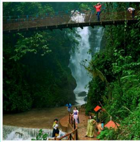
CATARATA DEL RÍO TIGRE