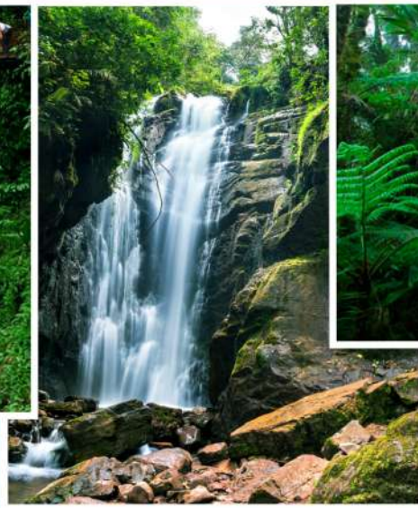
CASCADA EL LEÓN